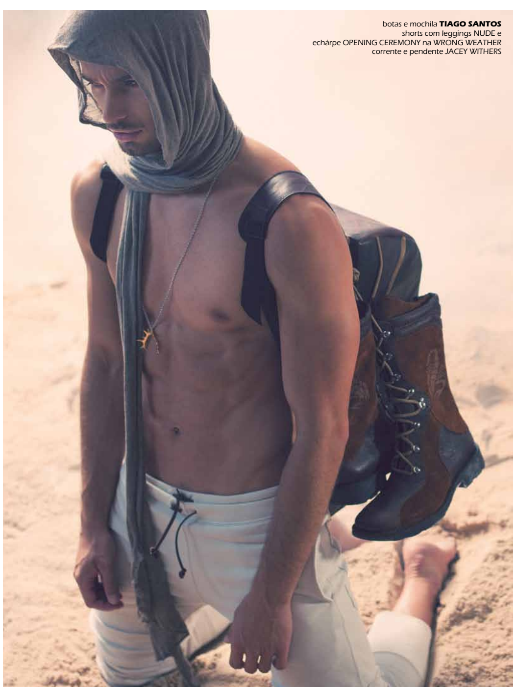
Botas e mochila TIAGO SANTOS shorts com leggings NUDE e echarpe OPENING CEREMONY na WRONG WEATHER corrente e pendente JACEY WITHERS