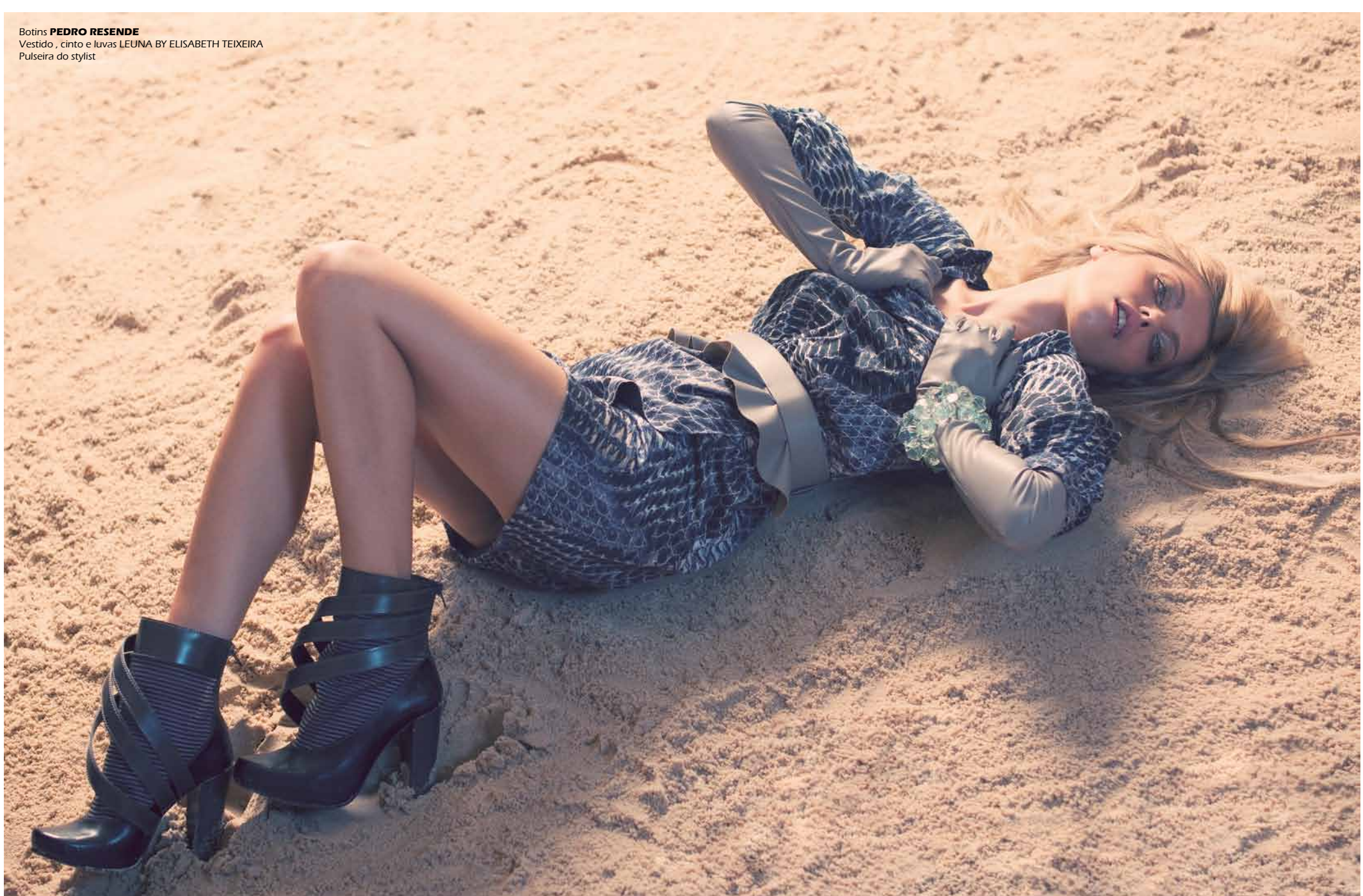
Botins PEDRO RESENDE Vestido, cinto e luvas LEUNA BY ELISABETH TEIXEIRA Pulseira do stylist