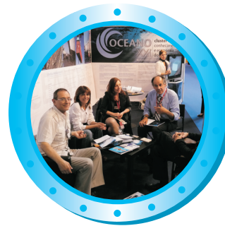
Compradores Internacionais Encontros de Negócio