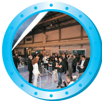
Feira internacional do conhecimento e economia do mar