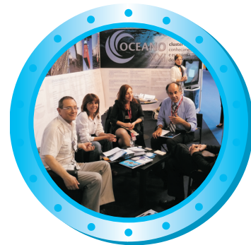
Compradores Internacionais Encontros de Negócio

CONVITE PROFISSIONAL INSCREVA-SE AQUI www.forumdomar.exponor.pt