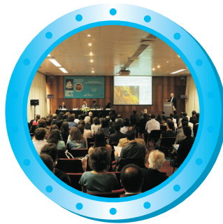
Conferências do Mar