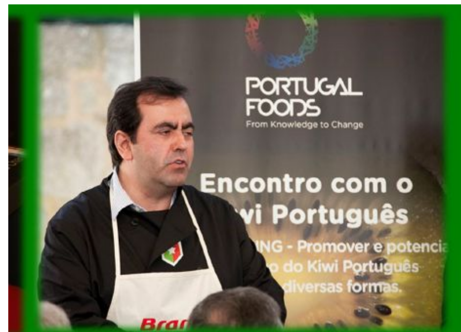
Encontro com o Kiwi Português 2010