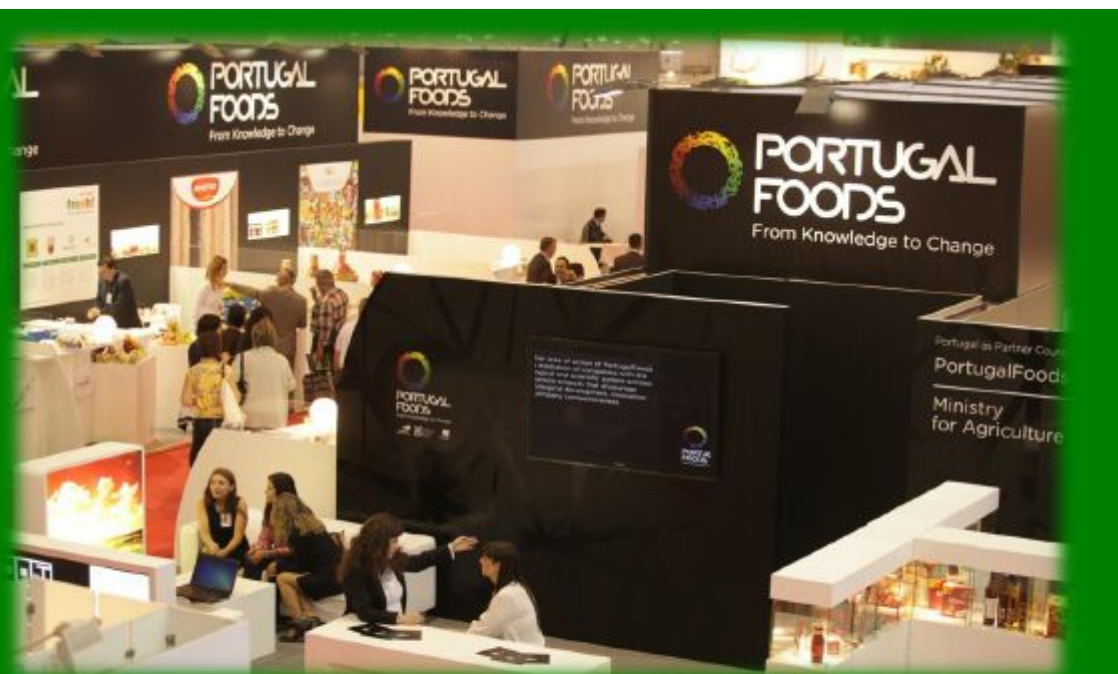
Feira Internacional de Agricultura de Novi Sad | Sérvia - Maio 2011

A presença de 51 empresas materializaram a maior presença conjunta de sempre da Fileira Agro-Alimentar Nacional numa Feira Internacional