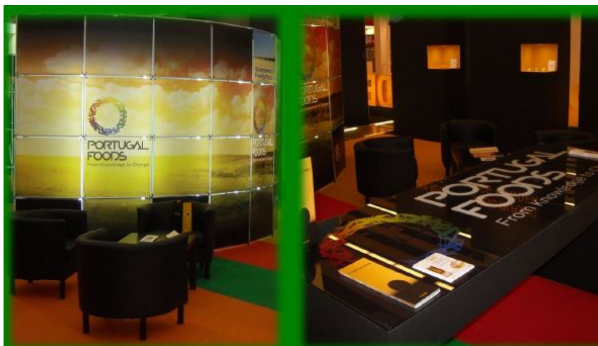
Feira Alimentaria, Barcelona 2010