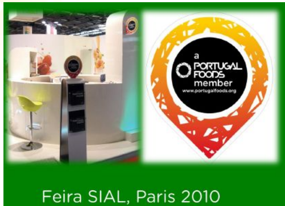
Feira SIAL, Paris 2010