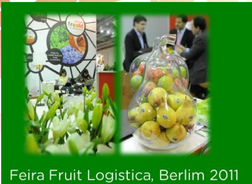
Feira Fruit Logistica, Berlim 2011