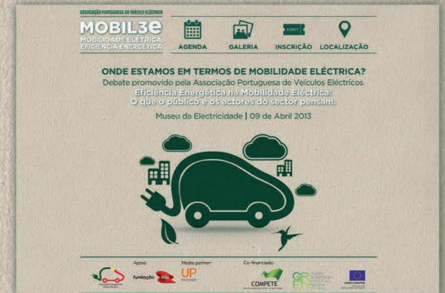
Fase 3 | imagem 2